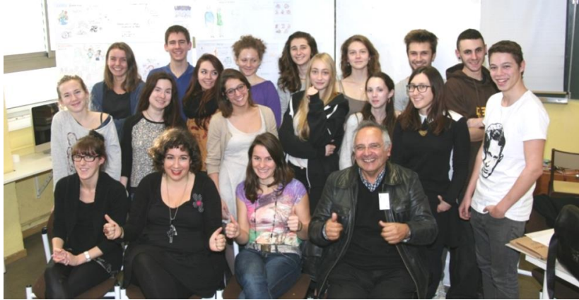
Classe de MANAA du lycée Marie Curie en 2015/2016

Nous avons commencé l'adaptation du diaporama, sur la partie graphique en partenariat avec la classe de Mise à Niveau en Arts Appliqués du lycée Marie Curie et sur le volet physique-chimie avec le lycée Pierre Mendès France.